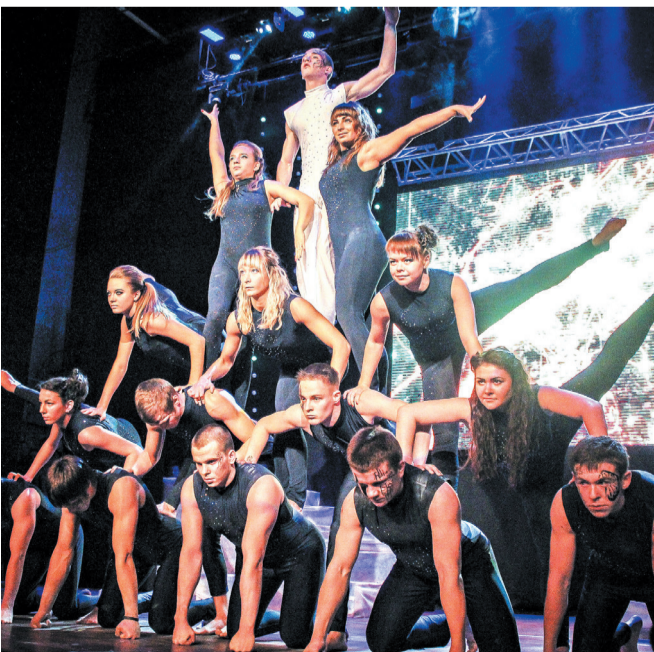
Юбилейный концерт. «Первый снег», 2013 год.

Каждый студент КемГУ знает, что такое «Первый снег». Но далеко не каждый знает историю фестиваля. Впервые фестиваль «Первый снег» прошёл в 1984 году. Это значит, что в этом году он пройдет в 35-й раз.