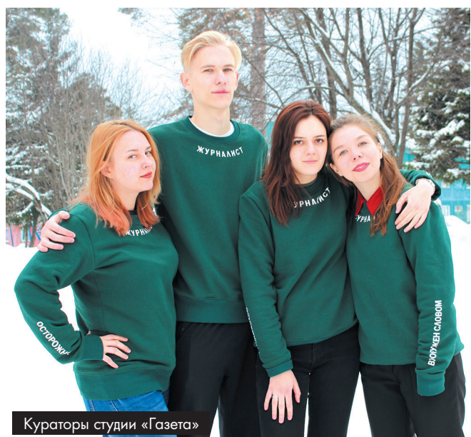
Кураторы студии «Газета»